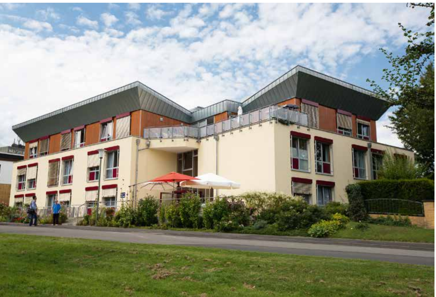
Hausgemeinschaft „Am Heimbach“ des Albert-Kolbe-Heims, Kassel