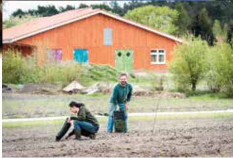
Sortierhalle der Baukhöfe, Stütensen