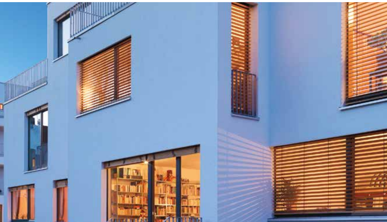
Baugruppe Scharnweberstraße, Berlin